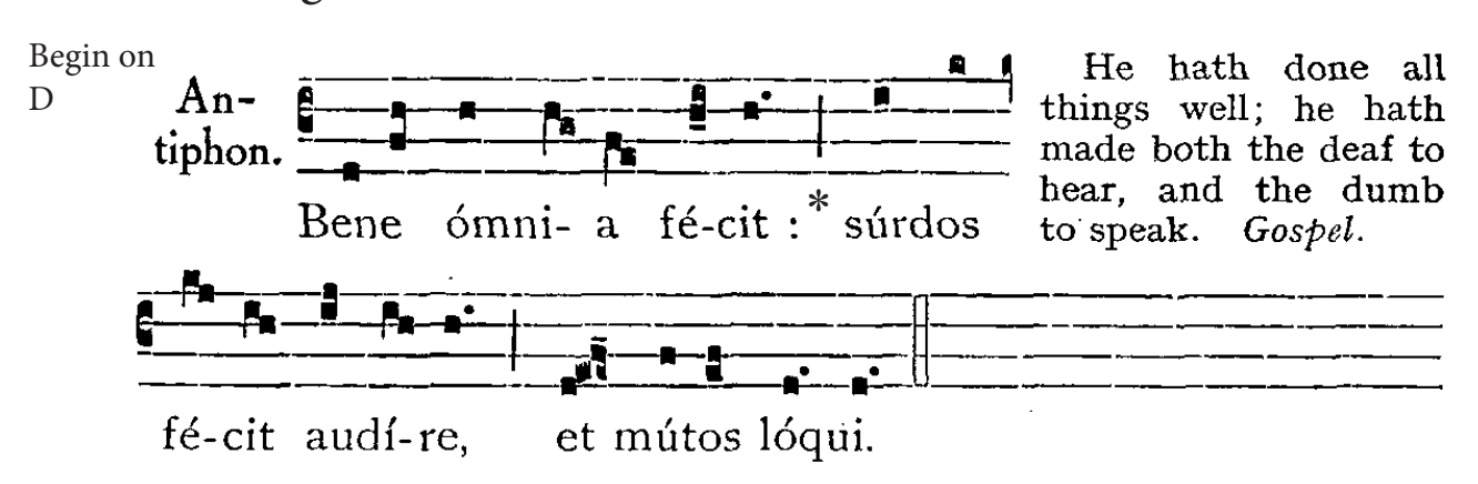
Tone 5 a.